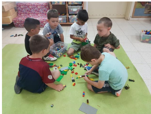
פעילות משותפת של ילדי הגנים 'דקל' ו'זית'